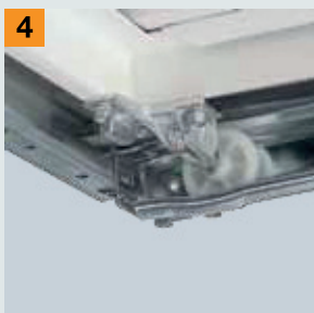
Parkering til kørerullerne

Ønsker du mere sikkerhed? Så henvend dig til din Hörmann-forhandler!